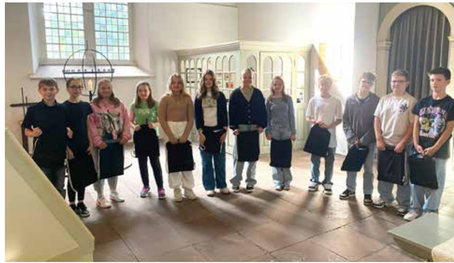
Unsere neuen Konfirmand*innen aus Altluneberg

55 Konfis konnten wir begrüßen. Sie sind die ersten, die ein einjähriges Modell durchlaufen und bereits im September 2025 konfirmiert werden. Sie treffen sich alle gemeinsam an 9 Freitagen im Beverstedter Gemeindehaus und sie fahren im April nächsten Jahres zur Flotte.