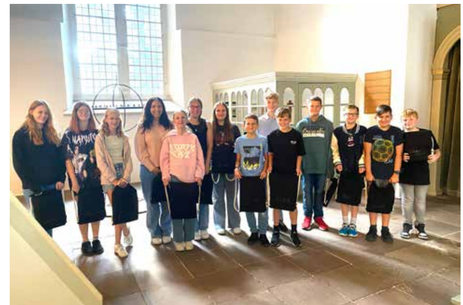
Unsere neuen Konfirmand*innen aus Lunestedt