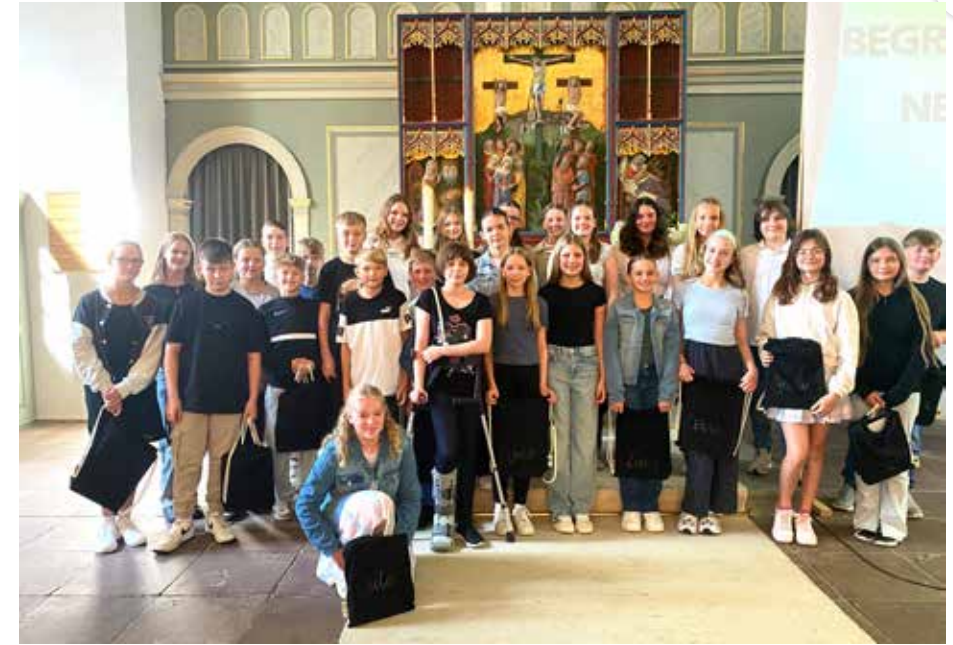
Unsere neuen Konfirmand*innen aus Beverstedt